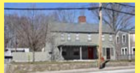
Colonial RUMFORD $229.900