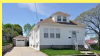
Bungalow EAST PROVIDENCE $179.900