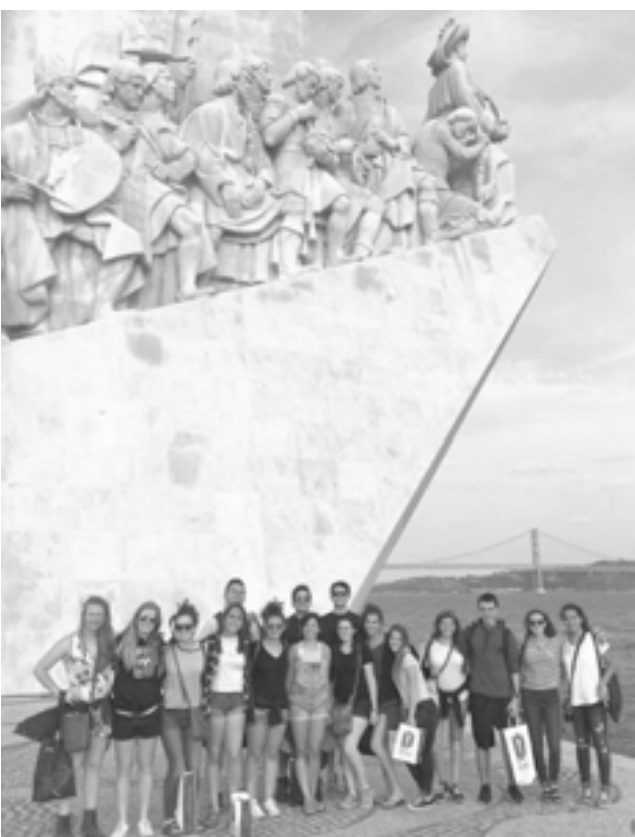
O grupo de estudantes de Hudson junto ao Padrão dos Descobrimentos, em Lisboa.