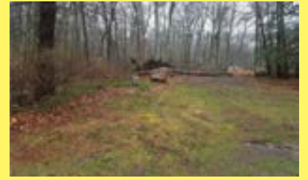
Terreno REHOBOTH $169.900