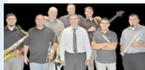
BANDA SEM DÚVIDA