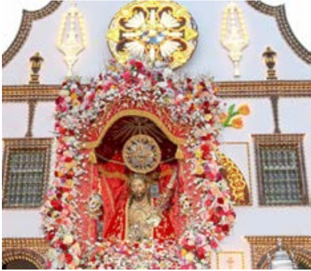
Imagem do Santo Cristo voltou a percorrer as ruas de Ponta Delgada

A imagem do Santo Cristo voltou no passado domingo a percorrer as ruas de Ponta Delgada, em São Miguel, numa procissão que este ano contou com a participação do Presidente da República, Marcelo Rebelo de Sousa.