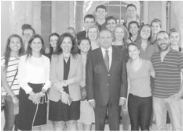
O grupo de estudantes visitou a Assembleia da República portuguesa, tendo-se avistado com Carlos César, antigo presidente do Governo Regional dos Açores e atual líder da bancada socialista (foto acima) e com Ferro Rodrigues, presidente da Assembleia da República.