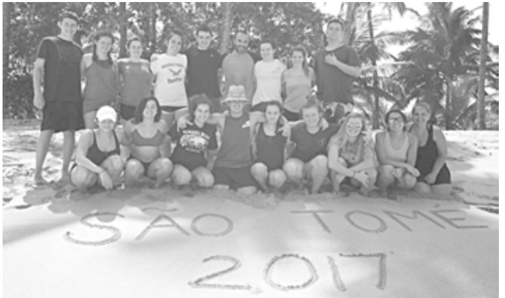
Na Praia Jalé, em São Tomé, onde o grupo acampou durante dois dias.