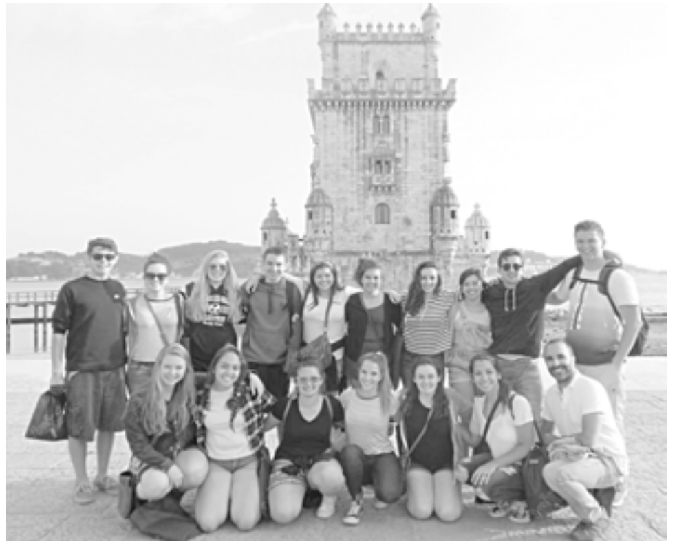
O grupo de estudantes de Hudson junto à Torre de Belém, em Lisboa.