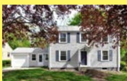
Colonial EAST PROVIDENCE $279.900