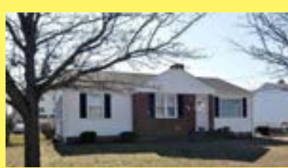
Ranch EAST PROVIDENCE $219.900