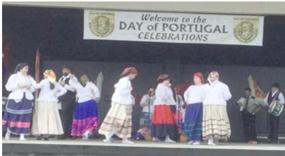
Um momento da exibição do Rancho Folclórico do Taunton Eagles.

tumes e tradições da terra dos pais e avós para que esta rica herança cultural continue viva”.