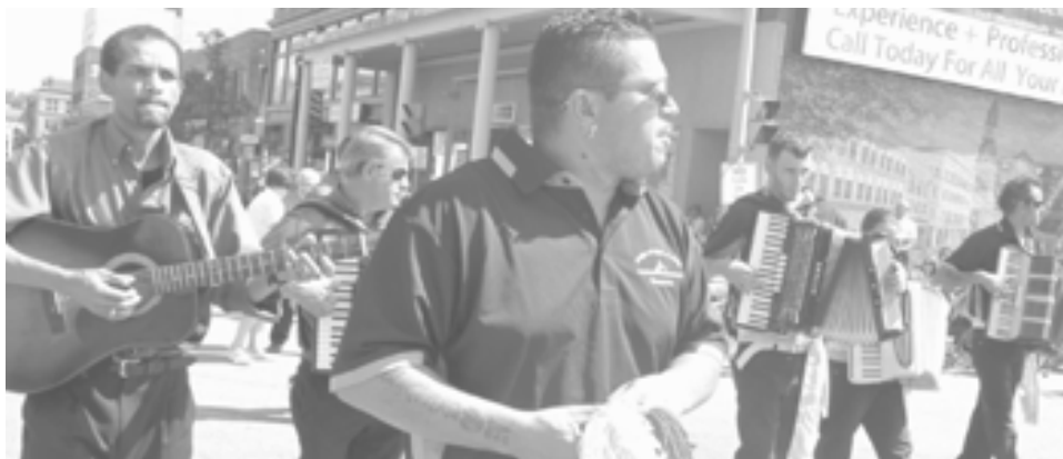
Amigos de Rabo de Peixe USA no cortejo etnográfico do bodo de leite das Grandes Festas em Fall River.

Atenda-se o que se passou em Havai, quando no século XIX muitos emi-