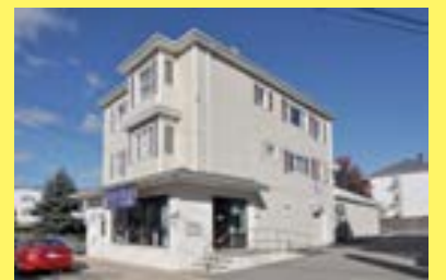
Comercial/2famílias NORTH FALL RIVER $279.900