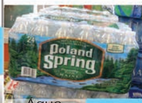
Água Poland Spring