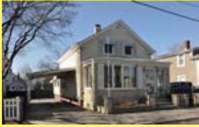
Cottage EAST PROVIDENCE $169.900

• Várias casas à venda • Preços baixos • Juros continuam baixos