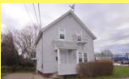
2 famílias EAST PROVIDENCE $139.900