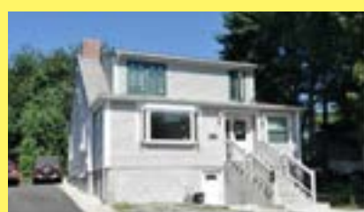
Cape CRANSTON $239.900