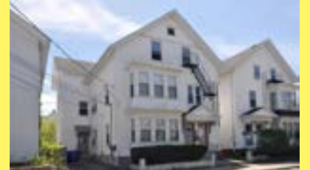
3 famílias PAWTUCKET $189.900