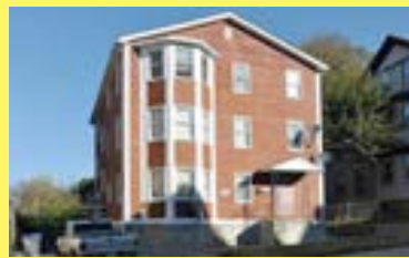
3 famílias EAST SIDE $299.900