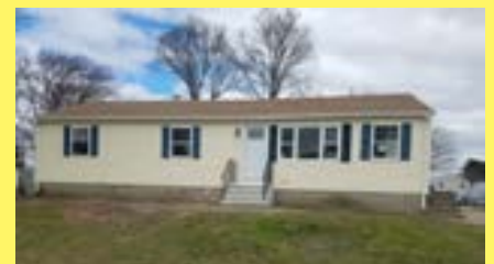
Ranch EAST PROVIDENCE $259.900

Contacte-nos e verá porque razão a MATEUS REALTY tem uma excelente reputação