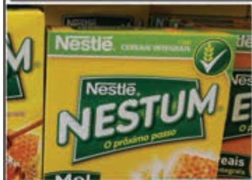
Papa Nestum Mel