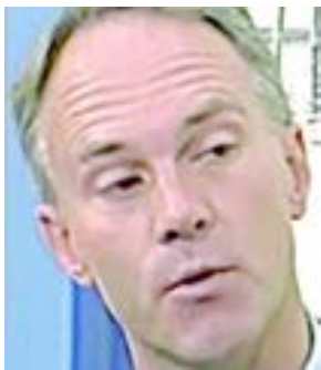
Jon Mitchell, mayor de New Bedford.

Os gastos com as escolas públicas de New Bedford