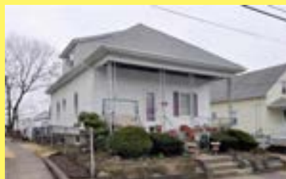
Bungalow PAWTUCKET $179.900