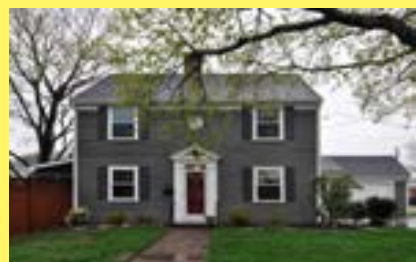
Colonial KENT HIGH $299.900