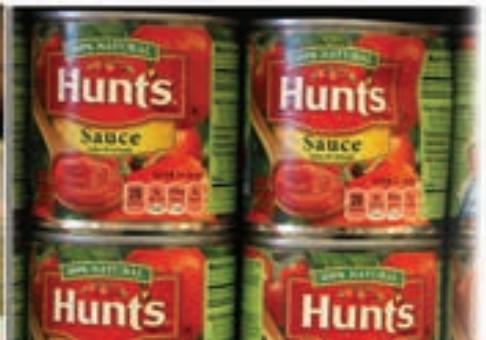
Calda de Tomate Hunts