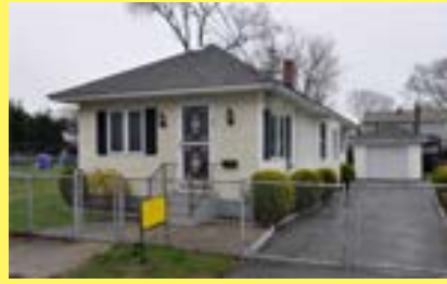
Bungalow RIVERSIDE $169.900