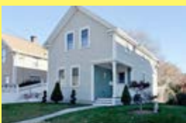
Colonial CENTRAL FALLS $169.900