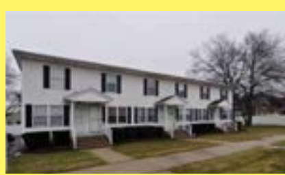
Condo JOHNSTON $119.900