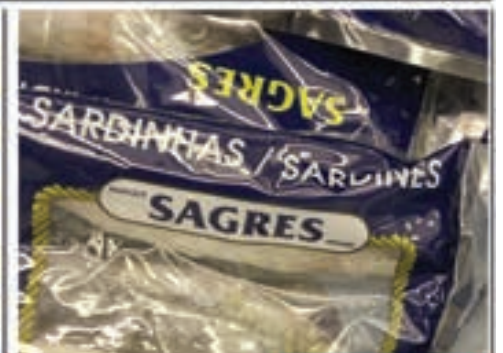
Sardinha Sagres Saco