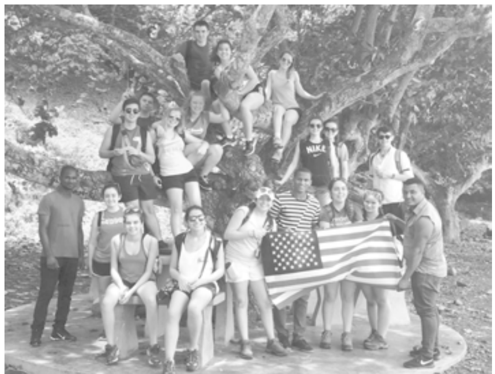
Na foto acima, o grupo de alunos da escola secundária de Hudson junto ao Padrão dos Descobrimentos de São Tomé.

férias é sempre os Açores, no caso de Hudson, Santa Maria.