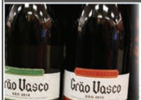
Vinho Grão Vasco