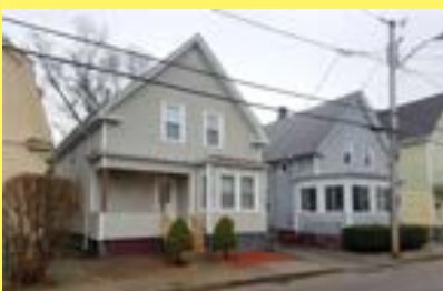
Cottage CRANSTON $179.900