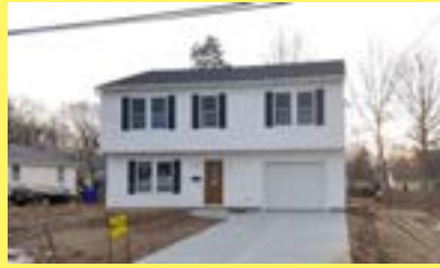
Colonial RUMFORD $279.900