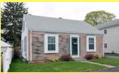
Cape PAWTUCKET $189.900